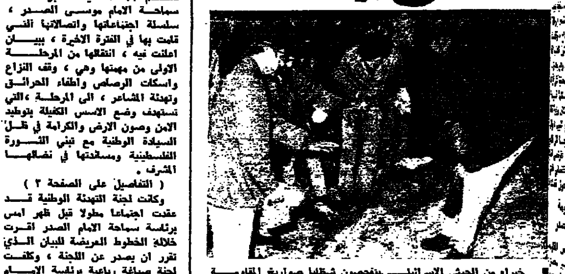
خبراء من الجيش الإسرائيلي يفتخرون بشلل صواريخ المقاومة